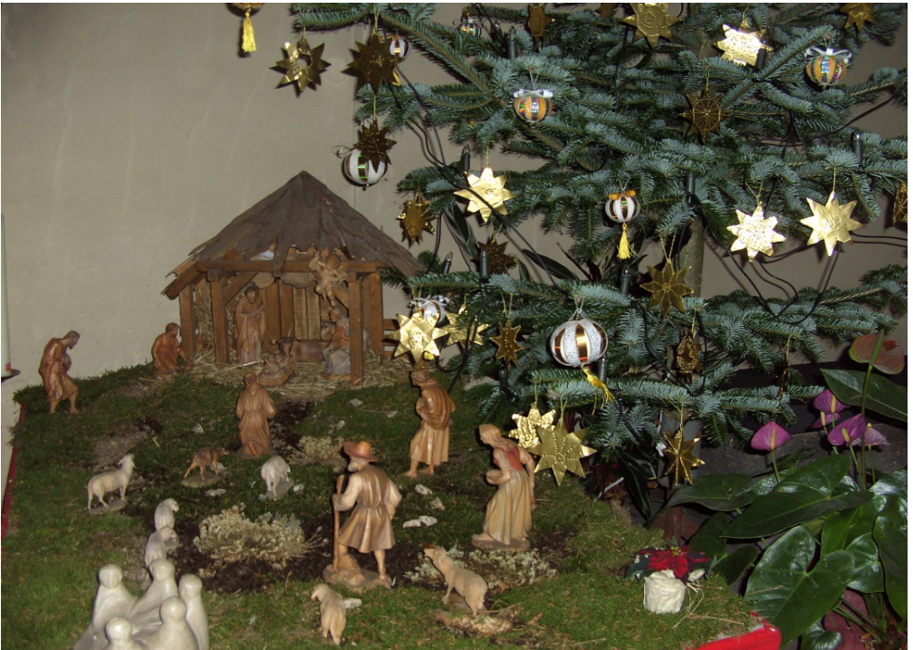
Krippe St. Georg Heinrichsthal

Wir wünschen ein gesegnetes Weihnachtsfest und ein friedvolles Jahr 2018