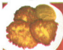
Kartoffelpuffer mit Apfelmus