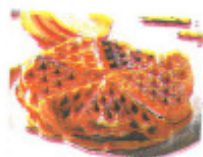
Waffeln und Kinderpunsch