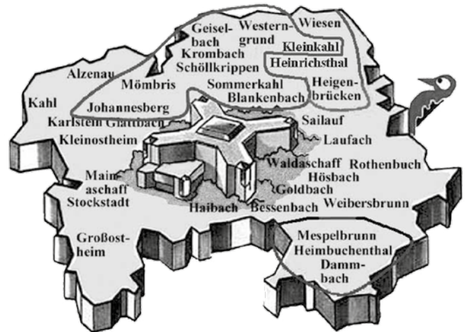
Logo des Landkreises Aschaffenburg mit freundlicher Genehmigung des Landratsamtes Aschaffenburg